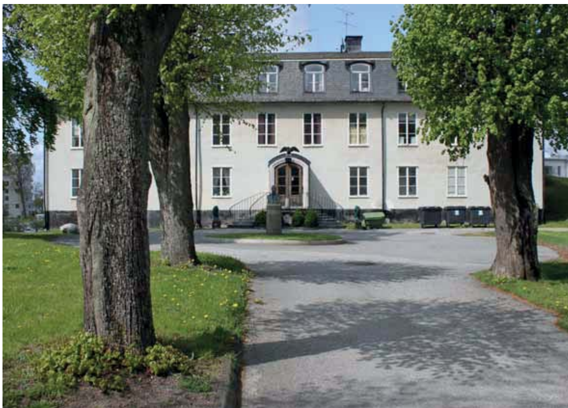
Kallhälls gård med en byst föreställande E.A. Bolinder framför entrén.

Historiska spår i Kallhälls gårds omgivning och närmiljö såsom byggnadernas placering, äldre vägsträckningar, allé, springbrunn, rondell och parken ner mot Mälaren typisk för herrgårdsanläggningar, fruktträdgård, skogsklädda bergspartier och solitära träd.