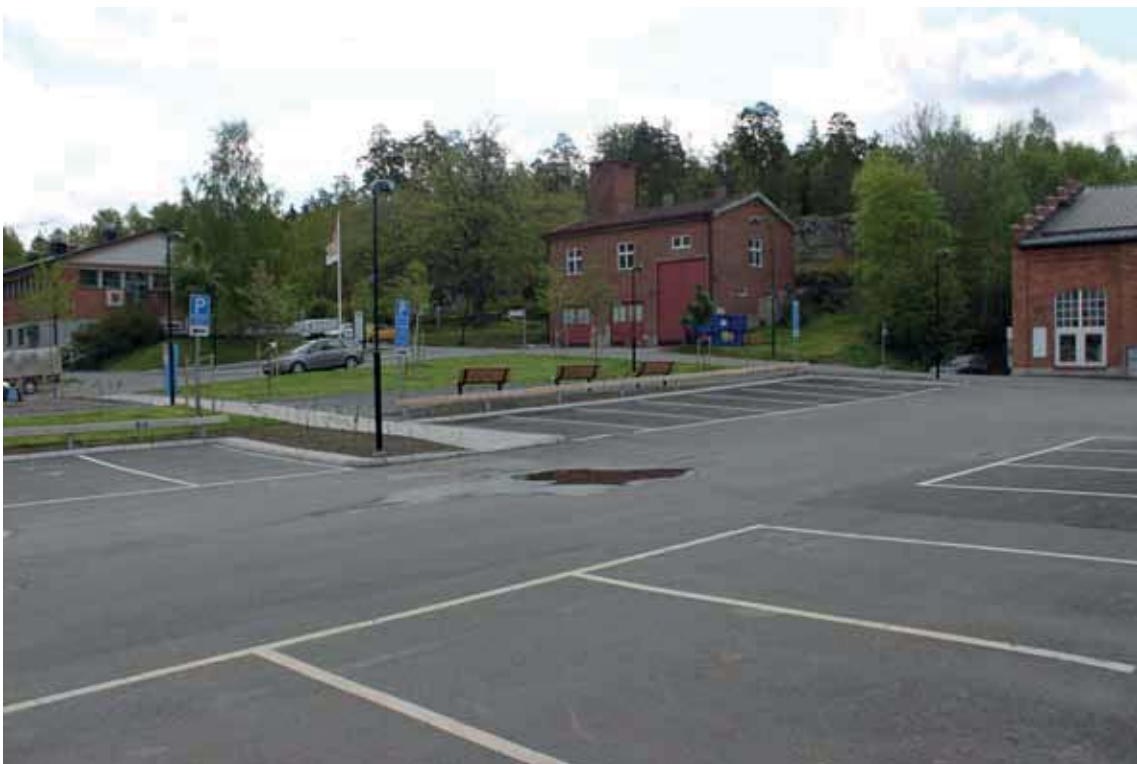
Utblick från fabriksområdet mot Fabriksvägen.