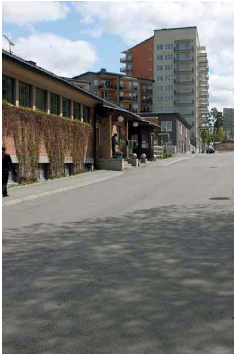
Det f.d. badhuset med "Bolinder Port".