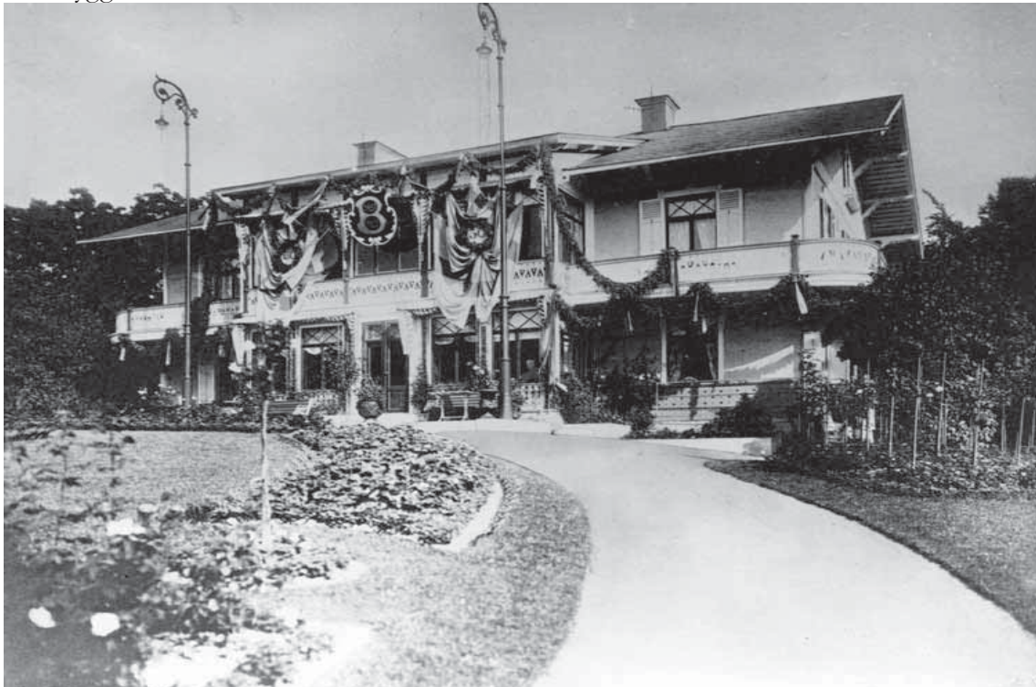
Kallhälls gård huvudbyggnad uppförd omkring 1863. Foto: 1913, Järfälla kommuns bild databas.

Kallhälls gårds dåvarande huvudbyggnad, uppförd omkring år 1863, togs till en början i anspråk som sommarnöje av Erik Bolinder. Byggnaden var uppförd i byggnadstidens schweizerstil med lövsågerier och glasade verandor. På 1940-talet byggdes villan om till huvudkontor för Bolinders Fabriks AB. Byggnaden ändrades genom att fasaderna slätputsades och taket byggdes om till ett brutet tak.