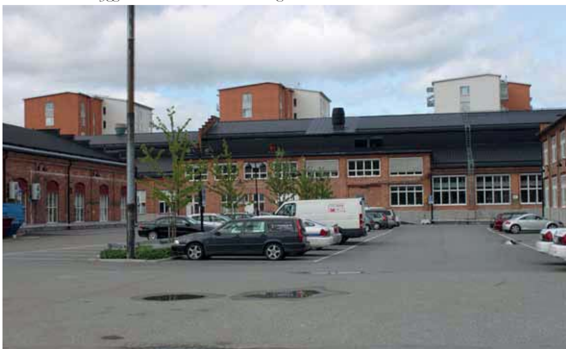
Bebyggelsen i "Kajenområdet" synlig över fabriksområdets bebyggelse.