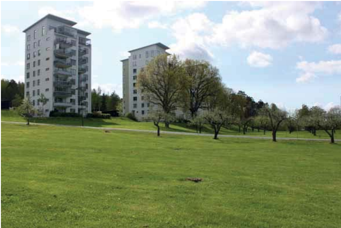
Området "Eksbacken" och äppeltriäd från gårdens tidigare trädgård.