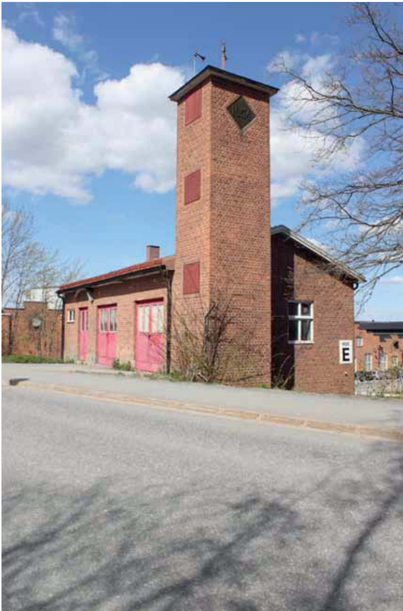
Brandstationen från 1954, byggnad D, uppförd efter de första utbyggnadsfaserna.

De moderna hallarna med fasader av plåt eller betong som representativa exempel för sin tids industriarkitektur och som visar på industriområdets långvariga användning och bidrar till områdets kontinuitetsvärden.