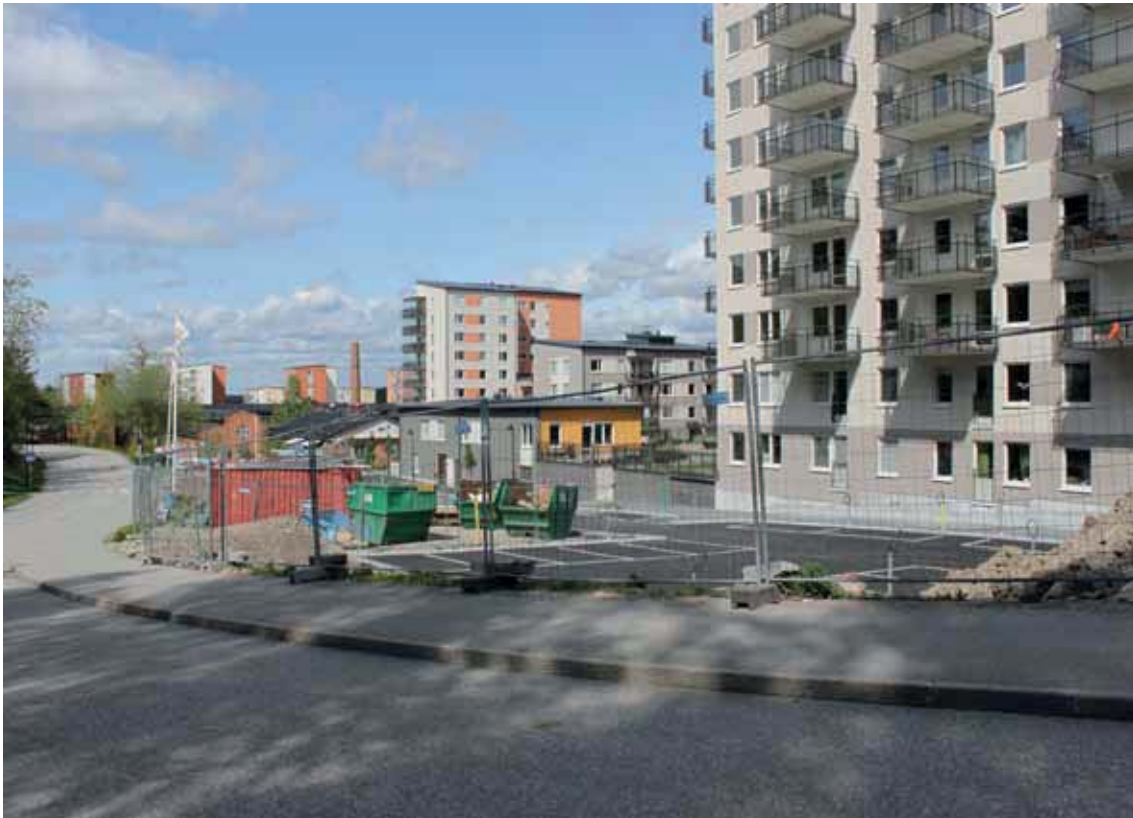
Ovan: Fabriksгатans vid Bolinder Port. Nedan: Bebyggelsen i "Bolinder Port".