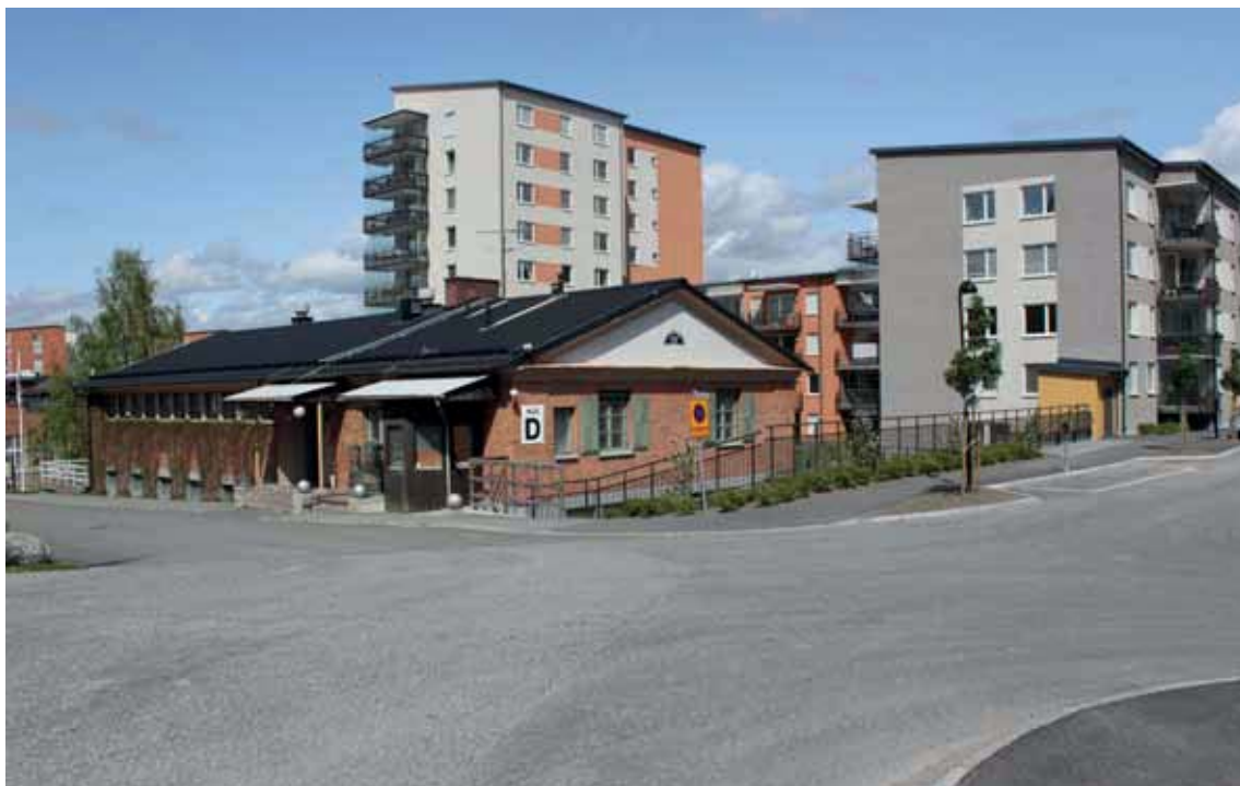
Det f.d. badhuset med bebyggelsen i "Entretorget".