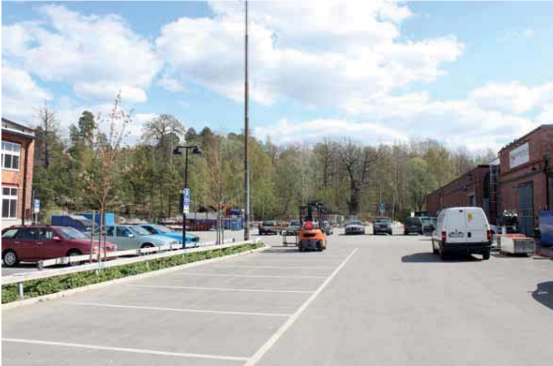
Utblick från miljöskapande platsbildning mellan byggnaderna A och K mot Godsvägen och skogsparti där ny bebyggelse föreslås.