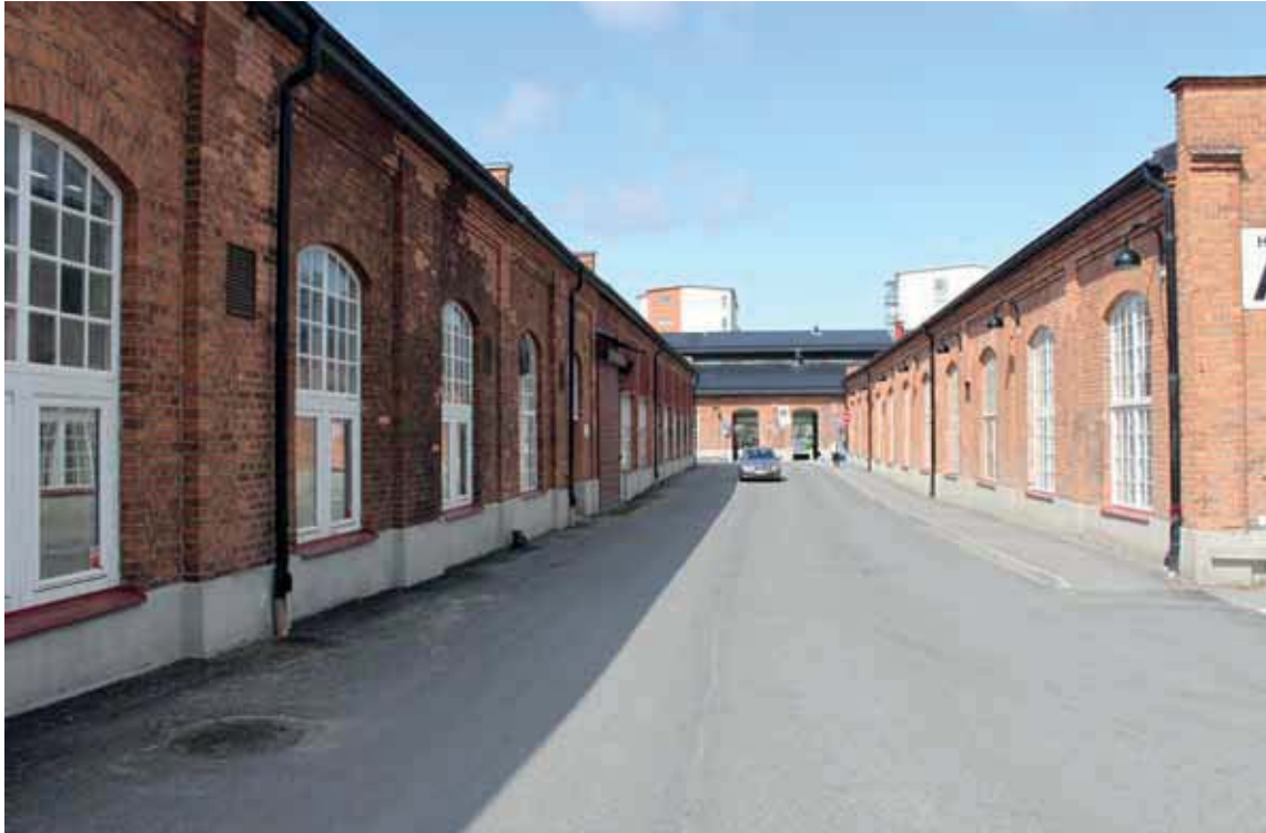
Vinkelrätt anordnad industrigata.