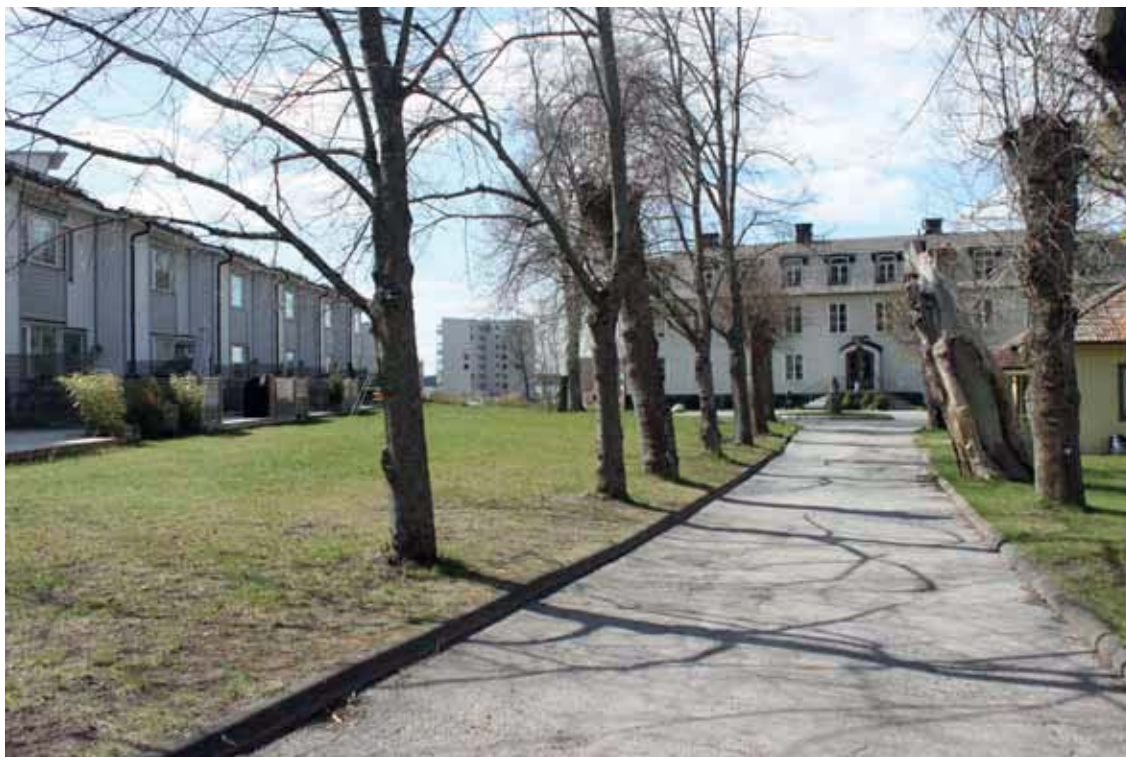
Kallhälls gård med allé. Biljardsalongen till höger om allén och nyuppförda radhus till vänster.

Landskapets karaktär kring Kallhälls gård har vid exploateringen påverkats genom en omgestaltning av en skiftande landskapsmiljö med småskalig bebyggelse till ett område som i huvudsak domineras av en stor homogen grönyta som omges av modern storskalig bostadsbebyggelse.