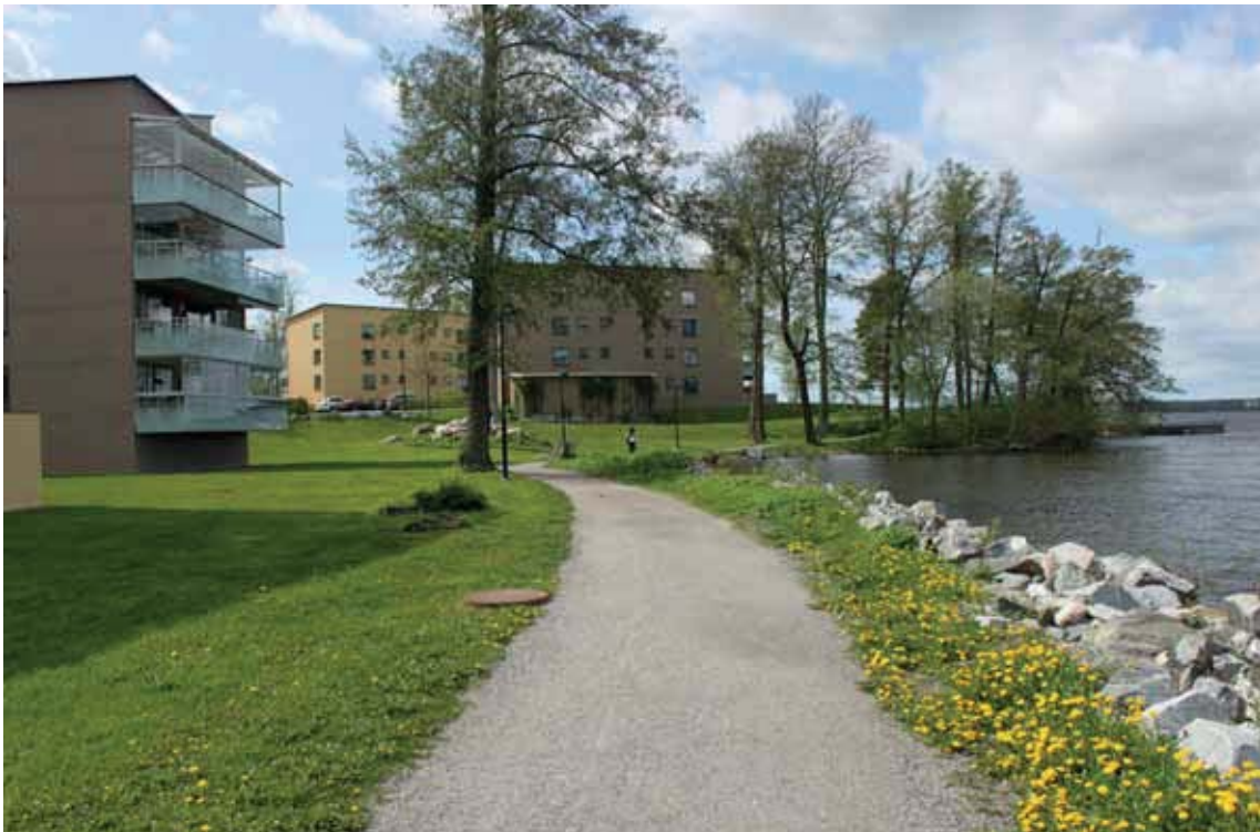
Området "Södra Udden" vid stranden. På Udden har grunden till den gamla ångbåtsbryggan bevarats.