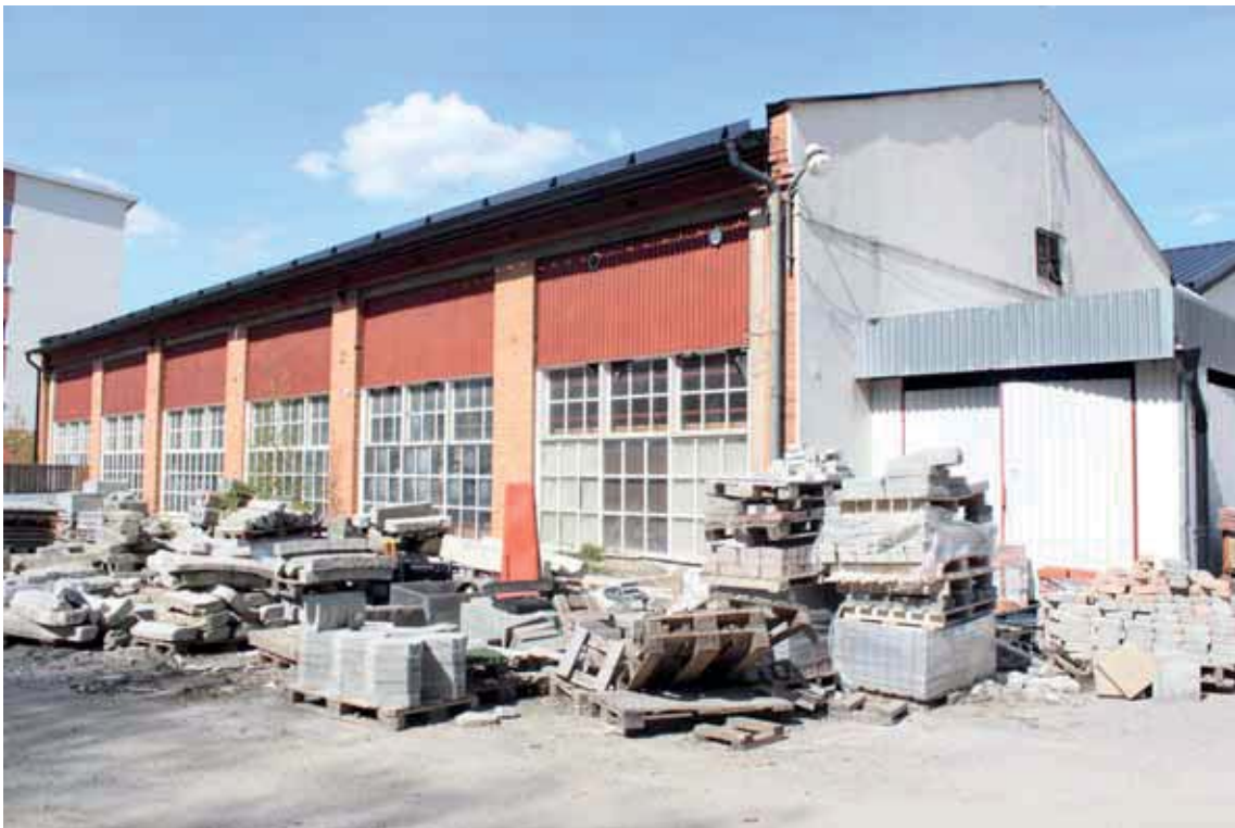
Del av byggnad C som föreslås rivas.