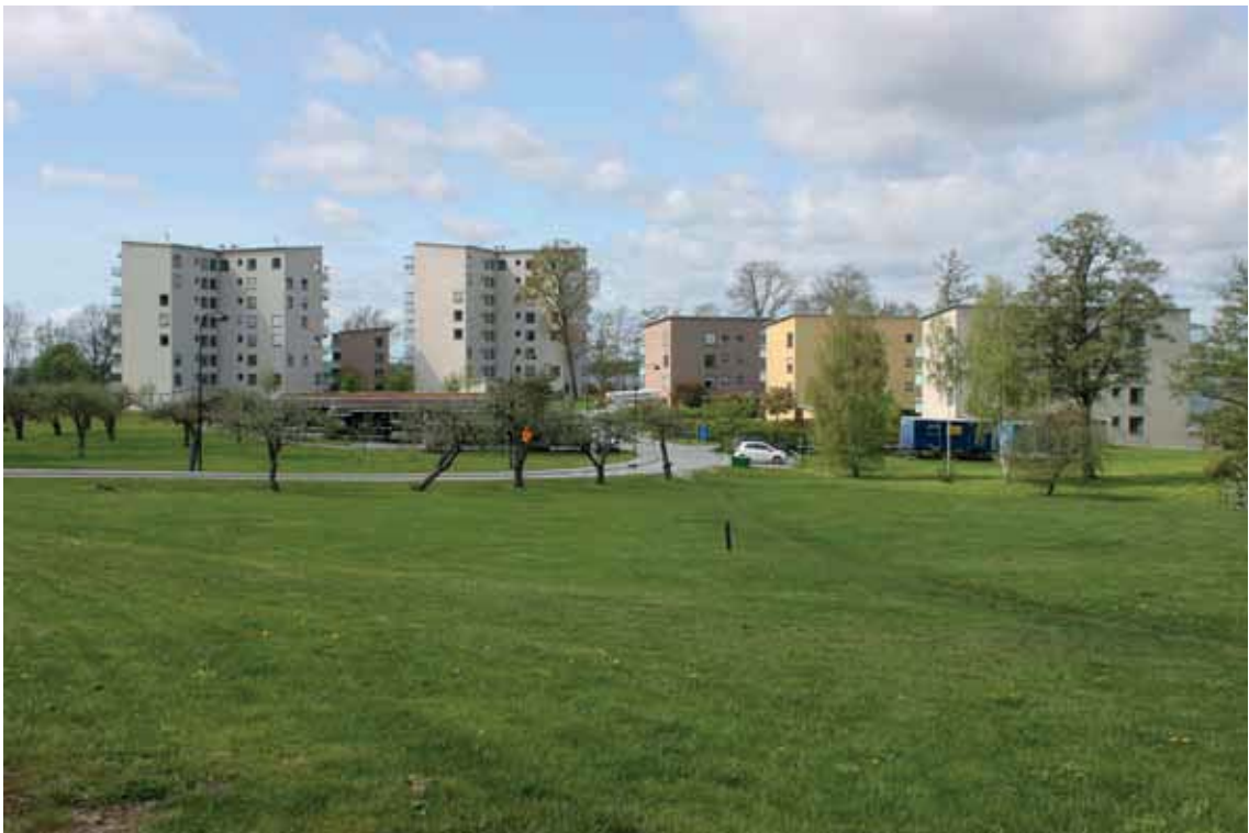
Området "Södra Udden".