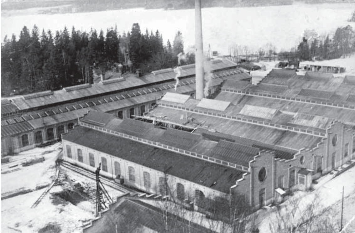
Bolinders fabriker bygger nya verkstadslokaler. Foto: före 1913. Järfälla kommuns bild databas.

Kallhälls gårds dåvarande huvudbyggnad, uppförd omkring år 1863, togs till en början i anspråk som sommarnöje av Erik Bolinder. Byggnaden var uppförd i byggnadstidens schweizerstil med lövsågerier och glasade verandor. På 1940-talet byggdes villan om till huvudkontor för Bolinders Fabriks AB. Byggnaden ändrades genom att fasaderna slätputsades och taket byggdes om till ett brutet tak.