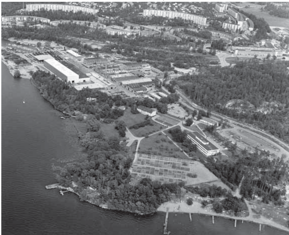
Kallhäll 1976.

I anslutning till fabriksområdet växte Kallhälls samhälle fram och förvandlades från ett jordbrukssamhälle till ett brukssamhälle där Bolinder styrde samhället och dess invånare.