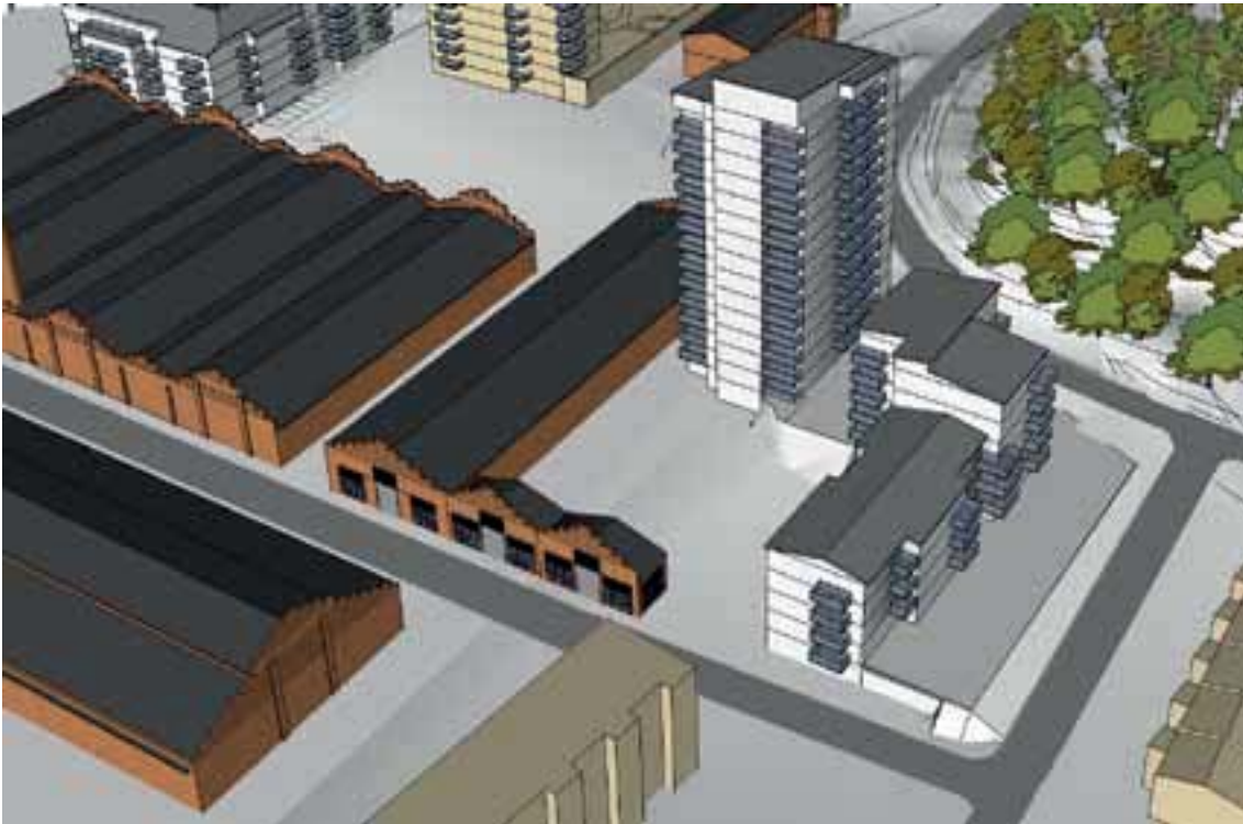
Föreslagen ny bostadsbebyggelse på tomten intill byggnad C. Befintlig bebyggelse föreslås rivas och enbart fasaden mot gatan bevaras.