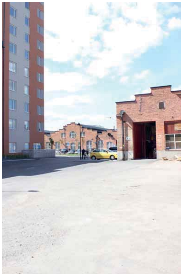
Byggnad A i mötet med "Entretorget"