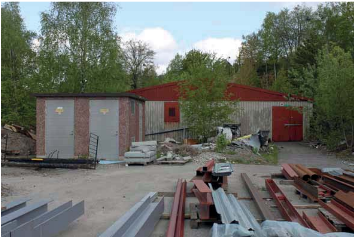
F.d. skyddsrum, byggnad N, föreslås rivas för att ersättas av ny bostadsbebyggelse.