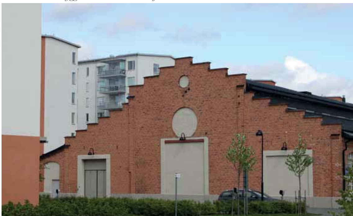
Byggnad B mötet med "Kajenområdet"