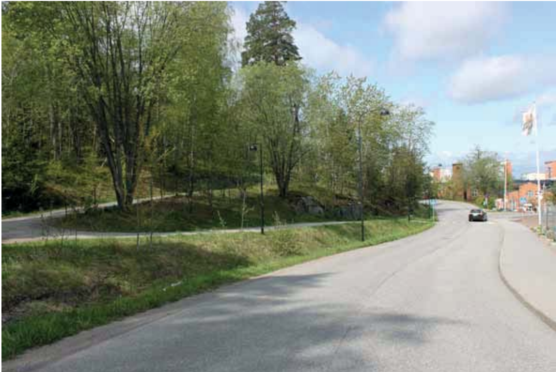
Fabriksvägen med naturområde som i förslaget föreslås sprängs ur för att ge plats åt ny bebyggelse.