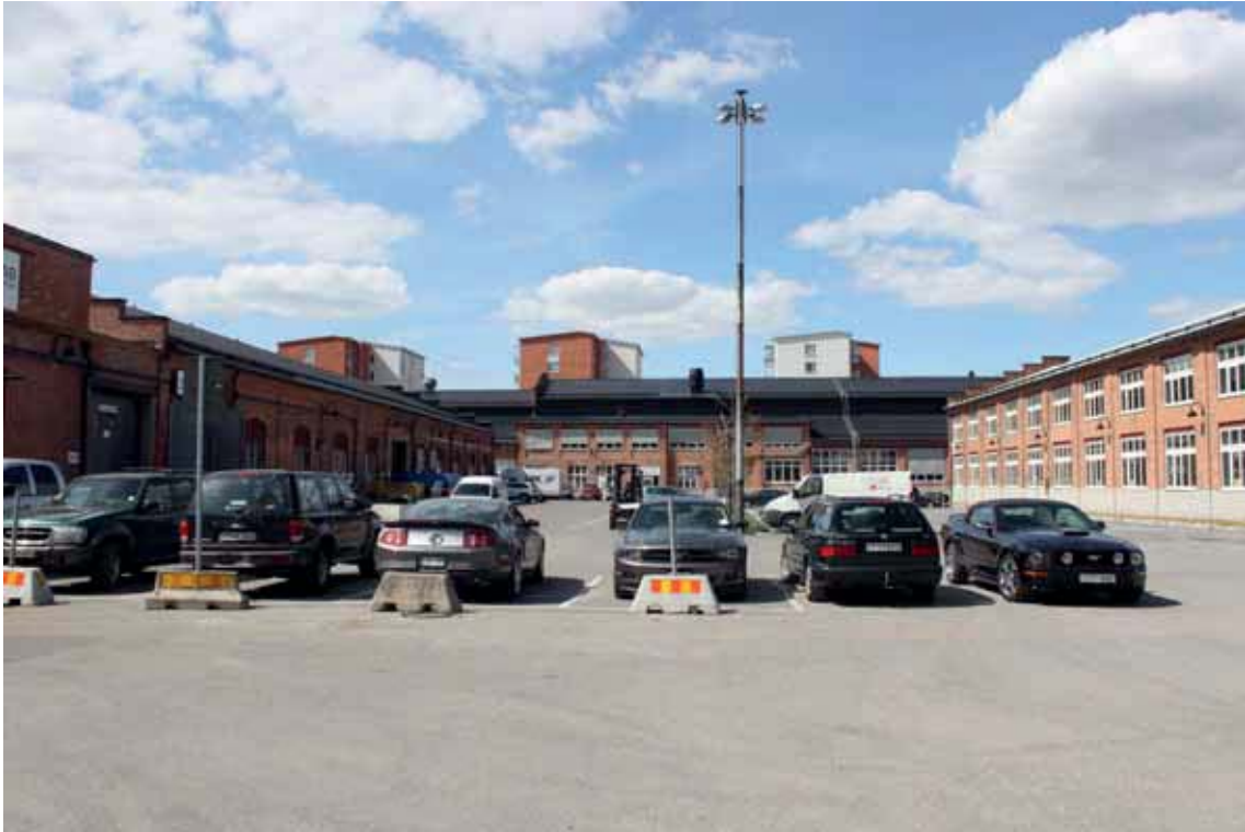
Miljöskapande platsbildning mellan byggnaden A, B och K.