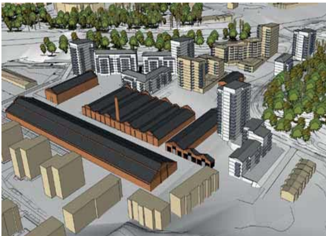
Ny bebyggelse föreslås på tomten intill byggnad C samt i områdets norra del. Ur Förstudie, Vidareutveckling Boländer Strand 2010-2015.

Förslaget att uppföra bebyggelse utanför områdets avgränsade miljö i naturmark med ändring av Fabriksvägen som följd påverkar en kulturhistoriskt intressant vägsträckning. Åtgärden medför också en minskning av den visuella upplevelsen från området som naturligt avgränsas av vägar och skogsklädda partier.