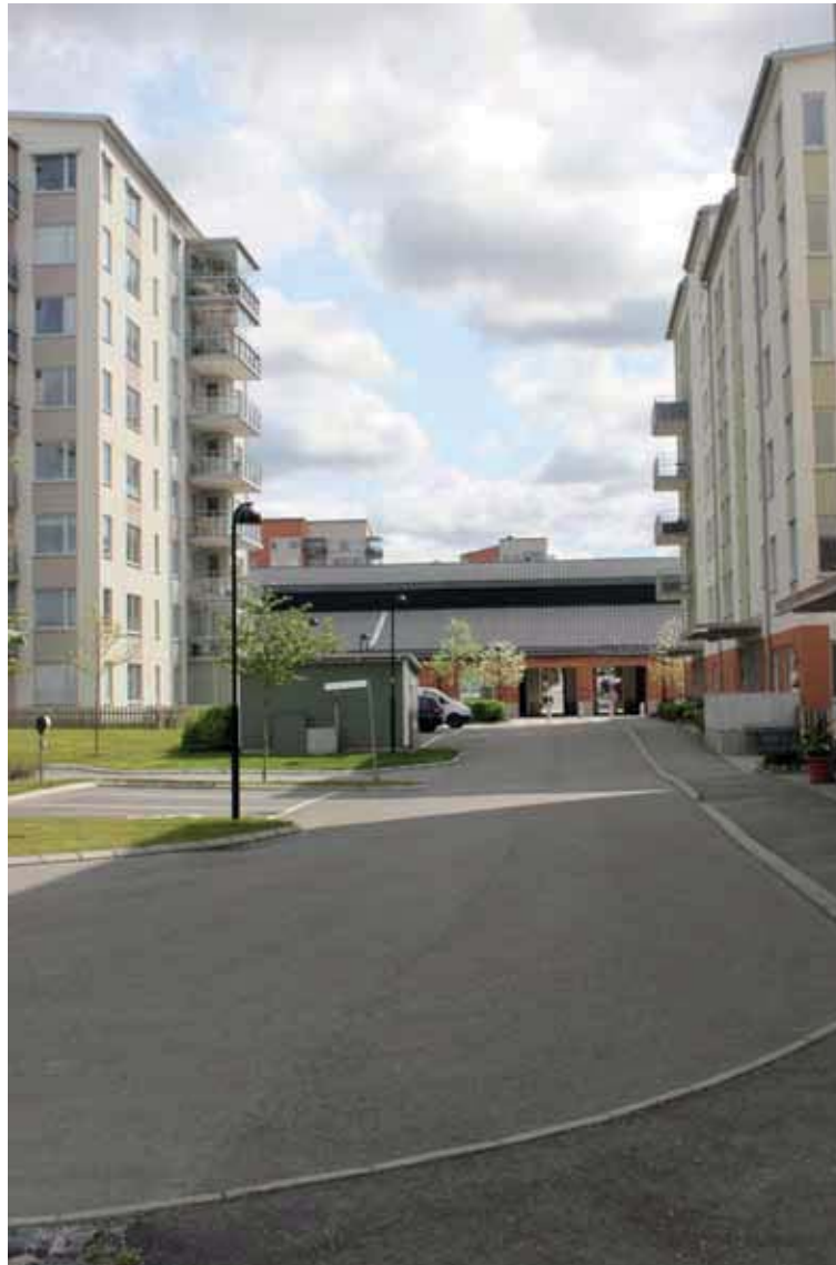
“Kajenområdet” i mötet med byggnad B i fabriksområdet.