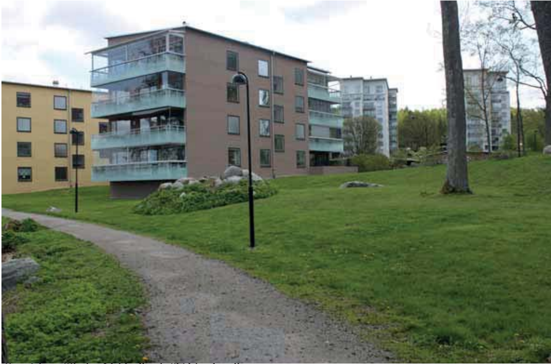
Områdena "Södra Udden" och "Ekbacken."