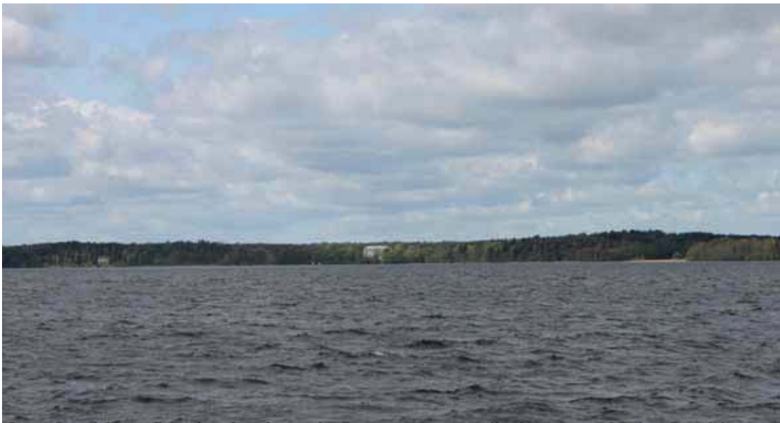
Ovan: Landskap i Görvälnsviken där gården Lennartsnäs är synlig från vattnet. Nedan: Landskapet vid Bolinder Strand.

Landskapet vid Görvälnsviken karakteriseras av skogsklädda stränder med enstaka inslag av herrgårdsanläggningar synliga från vattnet. Den nya bebyggelsen har skapat ett bostadsområde med närmast stadsmässig karaktär i ett strandnära läge väl exponerat från vattnet. Exploateringen har lokalt påverkat landskapsbilden i riksintresset, främst genom upplevelsen av landskapet från vattnet.