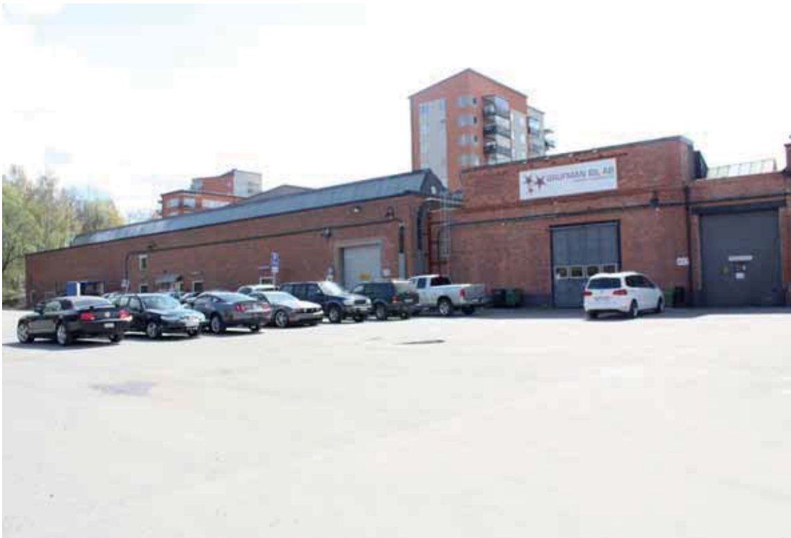
Byggnadsdelar i byggnad A som föreslås rivas för att ersättas av ny bebyggelse.