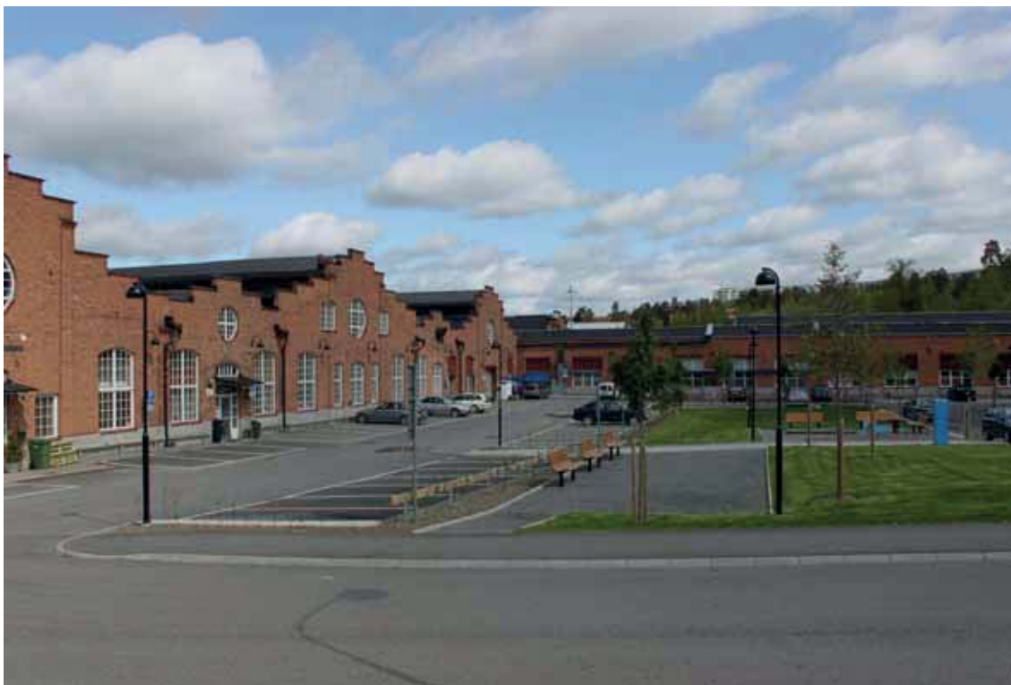
Miljöskapande platsbildning vid byggnaden A. Tillbyggnaden till höger i bild föreslås rivas för att ge plats för ny bostadsbebyggelse.