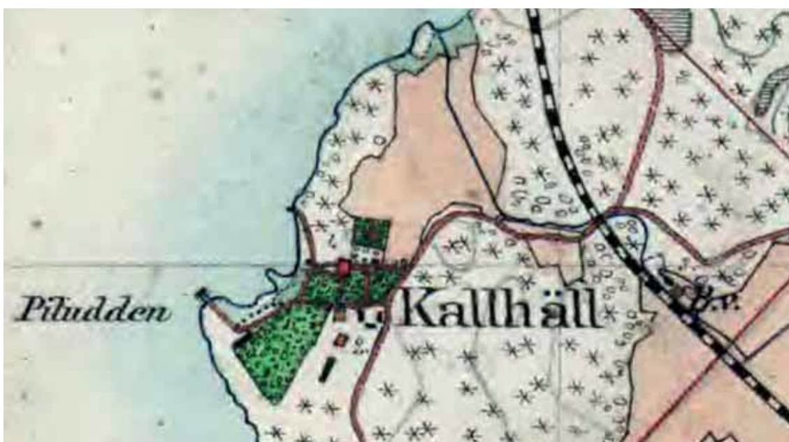
Kallhälls gård köps av Bolinders fabriker för att etablera ett fabriksområde. Utsnitt över Kallhälls gård 1905-06, Häradsekonomska kartan, Lantmäteriet.