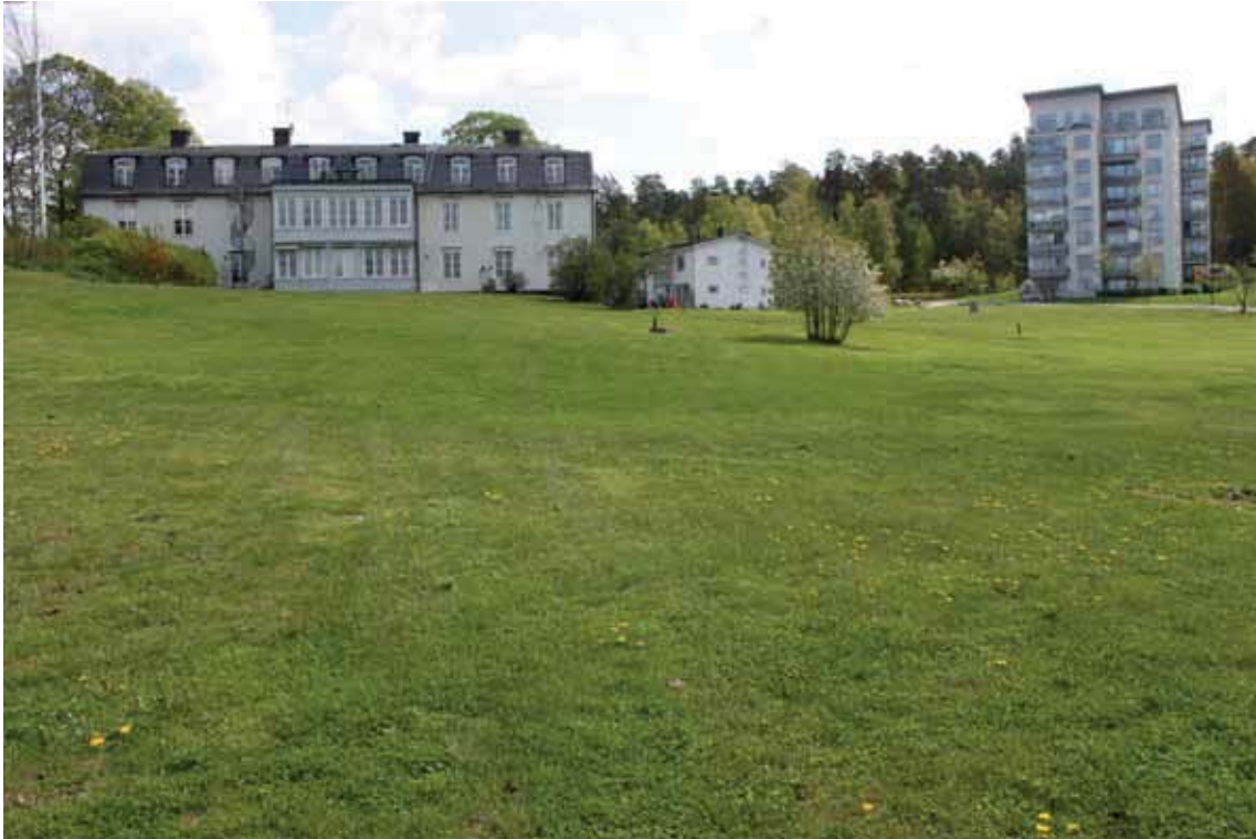
Kallhälls gård och området "Ekbacken".