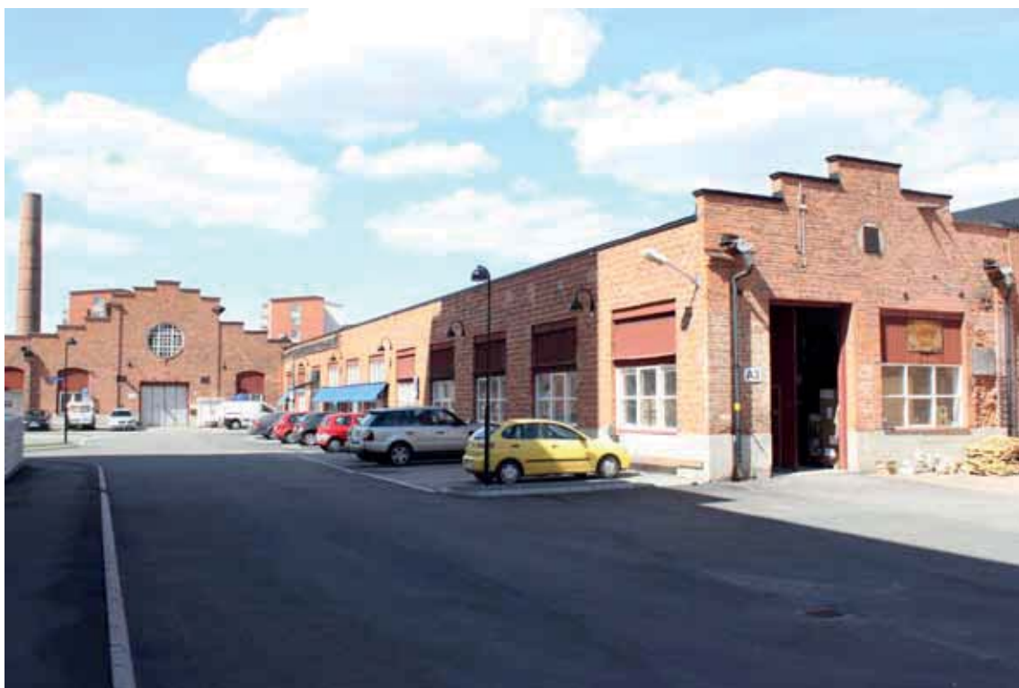
Byggnadsdelen till höger i bild, byggnad A, föreslås rivas för att ersättas med ny bostadsbebyggelse.