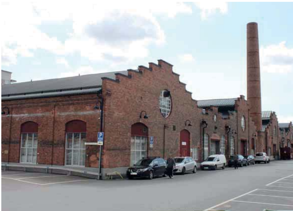
De äldsta verkstadlokalerna med skorsten, byggnad A.

De äldsta fabriksbyggnadernas välbevarade, tak, fasader, konstruktioner och detaljer, men även den senare kompletterande bebyggelsen av tegel som är typisk för sin tid men som genom materialval och storlek anpassats till den ursprungliga arkitekturen.