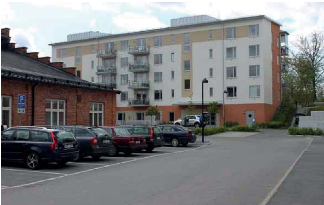
Byggnad B i mötet med “Lilla torget”