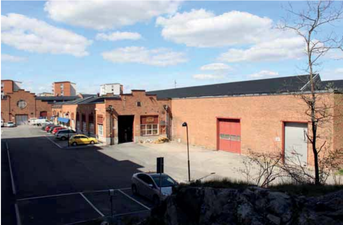
Byggnadsdelarna till höger bild, byggnad A, föreslås rivas för att ersättas av ny bostadsbebyggelse.