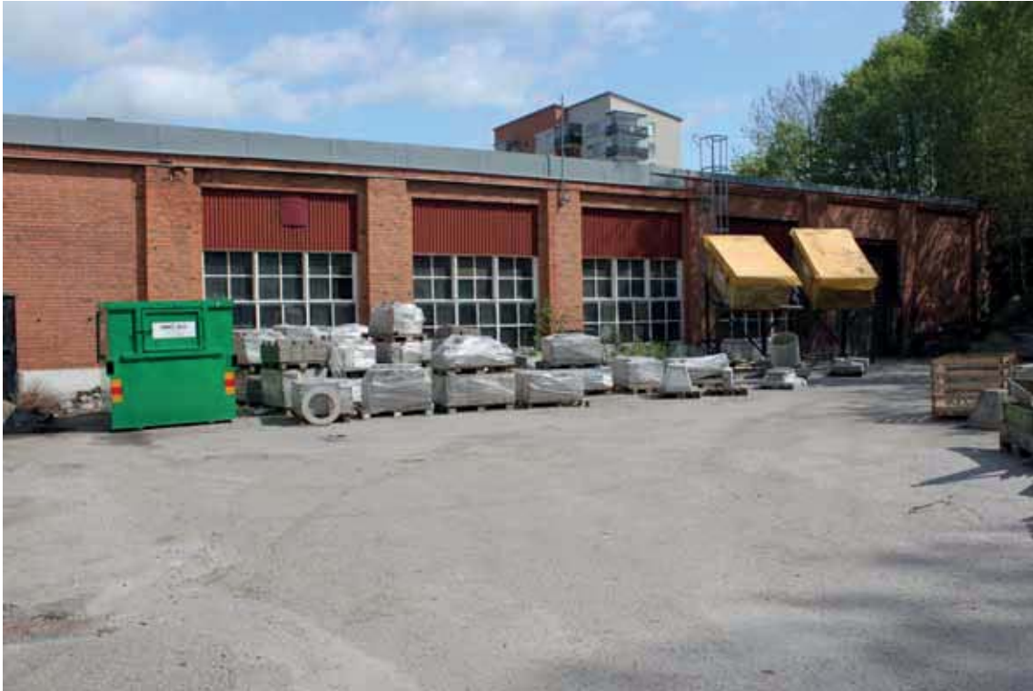
Del av byggnad C som föreslås rivas.