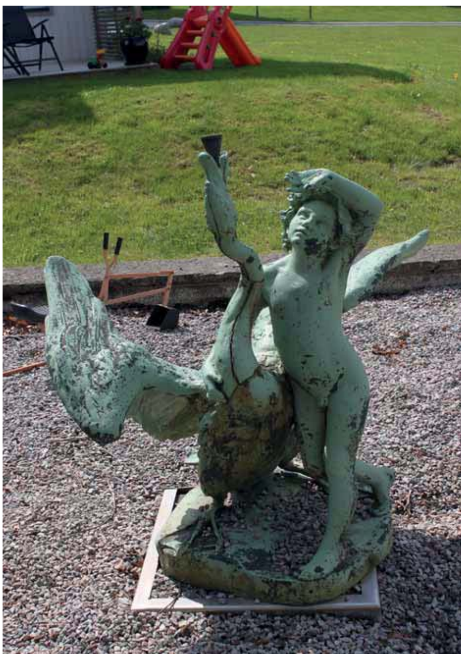
Skulptur i damm intill Kallhälls gård.

En rivning av Kallhälls gårds gamla huvudbyggnad medför påverkan på områdets utpekade kulturhistoriska värden då en rivning inte är i enlighet med de skyddsbestämmelser som utarbetats i detaljplanen för området. En för Kallhälls historia viktig byggnad skulle försvinna med konsekvenser för förståelsen för områdets historia samt en fragmentisering av den historiska miljön ytterligare. Byggnaden är av vikt för den kvarvarande miljön vid gården där biljardsalongen, rundeln med byst, damm och allé ingår som en sammanhållen enhet. Byggnaden omfattas av sådana byggnadshistoriska värden som inte går att ersätta med en ny byggnad med samma utformning. Förslaget att utreda om byggnaden kan rustas upp rekommenderas.