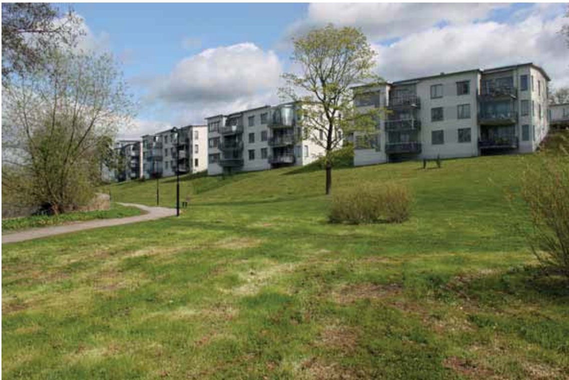
Området "Berget" intill Kallhälls gård.