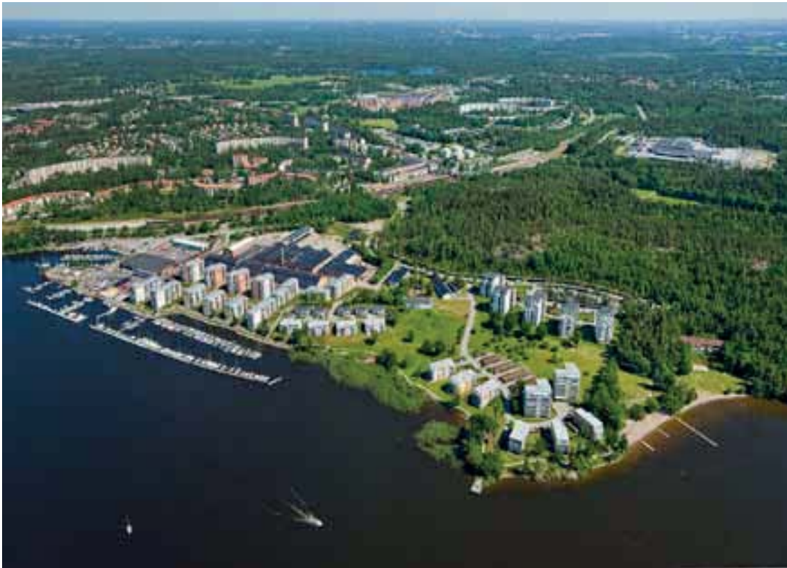
Vy över Bolinder Strand under utbyggnad. Ur JM's Förstudie.