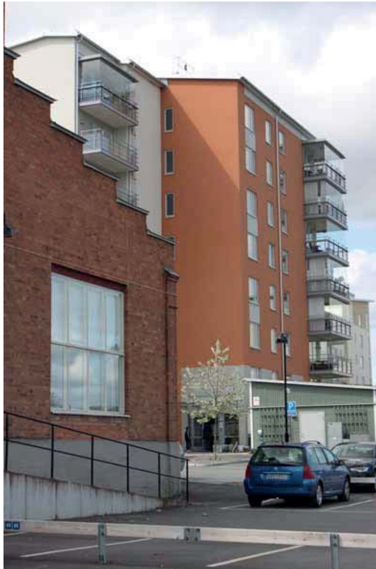
Byggnad B i mötet med "Kajenområdet".