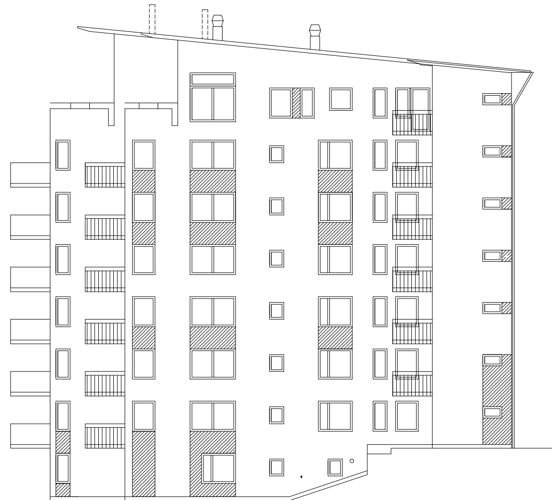
HUS 5 FASAD MOT SÖDER