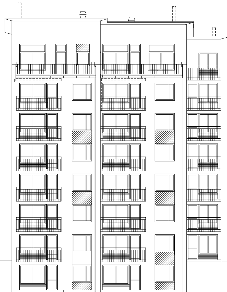
HUS 5 FASAD MOT VÄSTER